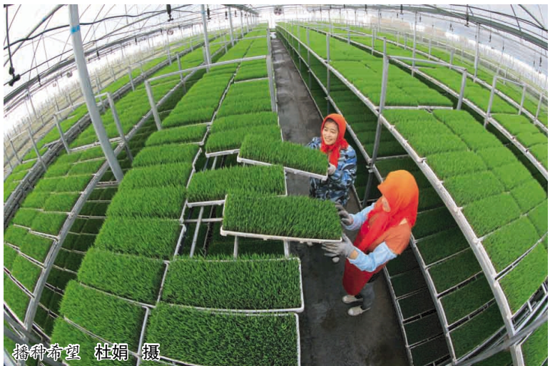
播种希望