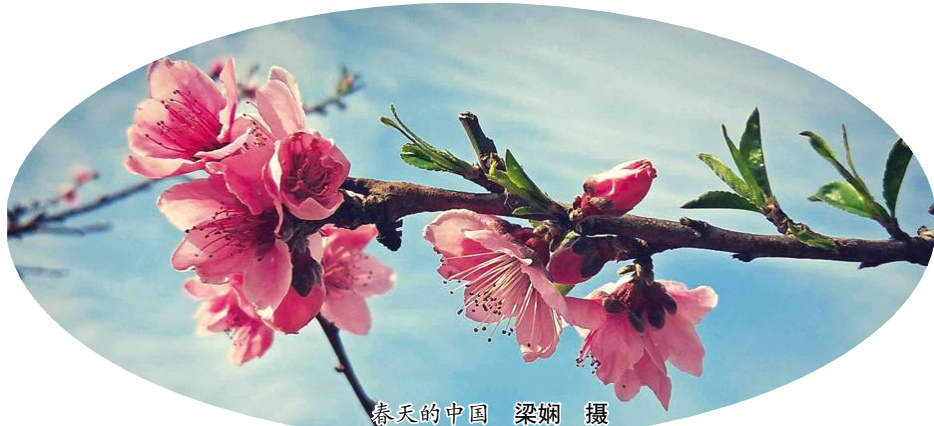
春天的中国