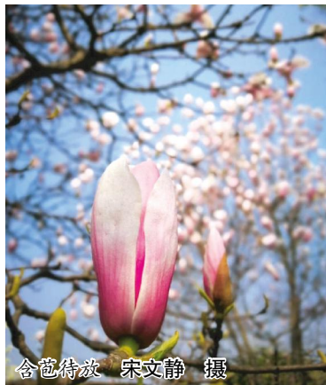
含苞待放

记得以前,在外漂泊的时候,若是遇到什么困难或是挫折,总是会不由自主地想起故乡,想起母亲。