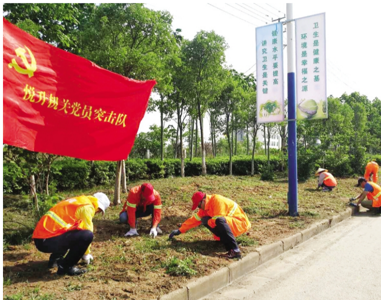
今年以来，徐圩悦升公司全面推行党员活动日制度，规定每个星期五为党员活动日，精心组织党员突击队围绕绿化保洁养护开展形式多样、丰富多彩的“党员活动日”活动，为支部建设标准化、组织生活正常化、党员服务精细化、阵地建设规范化夯实了基础。(杨波)

实施关爱民生环境提升项目，改善职工生活质量。实施惠民实事工程项目，投入75万元持续推进自来水升级改造，让全体职工群众喝上“放心水”。投入200万元实施西海岸风情小区配套工程，改善职工生活环境。投入50万元推进“创森工程”，助力创建国家森林城市。实施办公场所绿化工程，创建省级廉政文化示范基地，推进党建阵地建设，提升企业形象。(季兴胜)