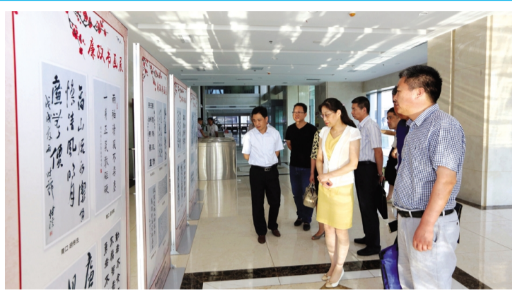
7月19日下午，参加集团纪委半年工作总结交流会的人员正在观看廉政书画摄影作品展。今年以来，为进一步推进集团廉政文化建设，积极倡导丰富多样的廉政文化内容和形式，不断推动廉洁理念深入人心，集团纪委、监察室紧扣“正风反腐”主题，举办了廉政书画摄影作品展，得到全公司广大爱好者的热情支持和积极参与。本次展览共展出书法作品30幅、绘画作品2幅、摄影作品5组。(工宣工纪)

党建工作再抓实。以“严格党员管理、提升党员意识、规范组织生活、促进作用发挥”为目标，进一步建立健全各项党建工作制度，不断提高制度执行力，使党建工作进一步制度化、规范化。加强阵地建设，不断提升党建水平。开展好“解放思想大讨论”活动，通过广泛开展大学习、大讨论、大调研，为全面推进高质量发展、努力实现后发先至凝聚广泛思想共识，提供强大精神动力。建设好多功能党建活动室和“党建e站”双阵地，实现学习、交流、宣传和互动等功能，党员学习教育随身、随时、随地。以落实“三位一体”廉洁风险防控机制建设实施方案为重点，着力提高全员廉洁风险防范的意识和能力，建立制度管用、预警及时的廉洁风险防控机制，扎实推进党风廉政建设。(顾孟)