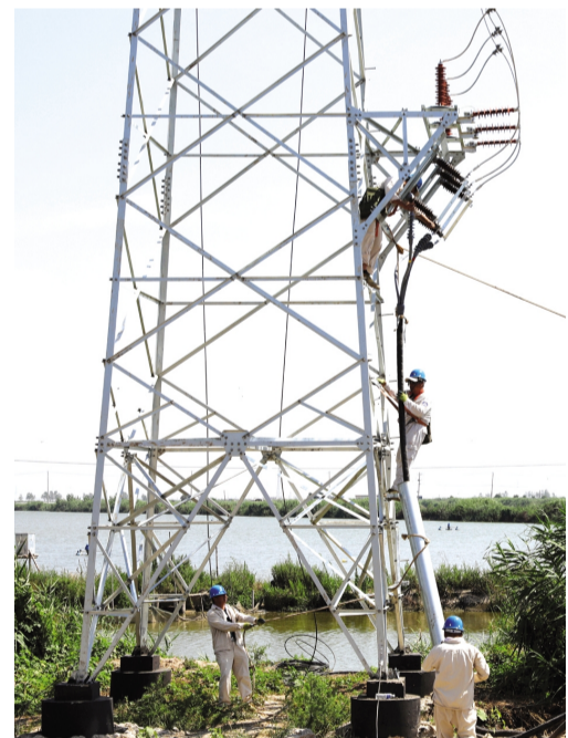
今夏已入伏!供电工程分公司的一线员工们在近四十度高温天气下,奔波在炎热的马路上,登上烫手的电杆,忙检修、保供电,全力以赴让用户用上及时电、安全电、放心电。(钱明华)

突出夯实基础,力争安全监管取得新突破。严格落实企业主体责任,坚持“党政同责、一岗双责、失职问责”管理要求,任务细化、措施硬化、工作深化,确保安全生产责任落实。继续利用学习培训、安全月活动、逢九活动日等形式组织员工认真学习和贯彻落实安全法律法规。及时发现和消除隐患,在夏季用电高峰及雷雨、台风等特殊季节,设立人员责任区,做到设备到人、责任到人、考核到人。(电办)