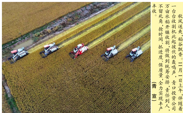
秋风送爽,稻谷飘香。二月一日上午,伴随着一台台收割机此起彼伏的轰鸣声,青口投资公司万亩水稻开镰收割,将做到统筹安排,责任到人,不留死角,抢时间,抓进度,保质量,全力实现丰产丰收。(青宣)

前新增土方回填开始施工。神特办公楼主体工程和附属工程,10月初完成了主体工程与附属工程的施工任务后,项目部又马不停蹄迅速组织人员对新增加的应急水池进行施工,10月底已完成钢板桩搭设、土方开挖等工作,预计11月底完成钢筋绑扎及混凝土浇筑。金博海旭花园27#、28#楼工程快马加鞭,各项附属工程交叉进行,道路、绿化同步推进,水、电、气基本开通,门面房和大门大理石干挂完成,目前正在零星工作扫尾,为本月中旬分户验收做好准备。(顾卫远)