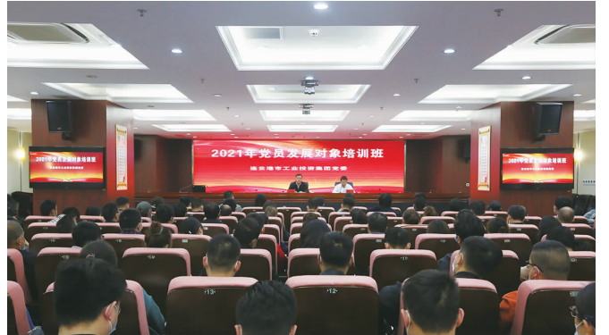
5月20日,集团党委启动为期三天的2021年党员发展对象培训班,105名发展对象参加培训。(工宣)