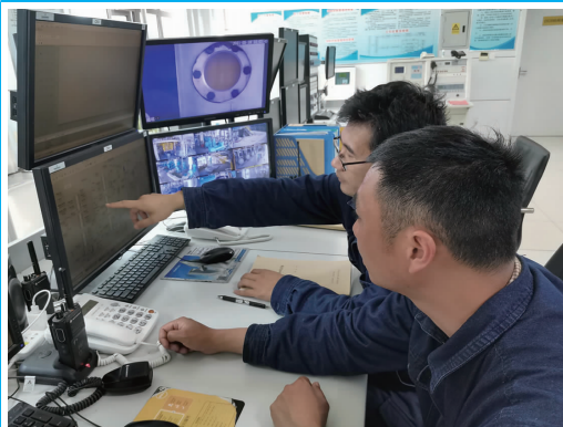
利海化工公司党总支把党史学习教育作为砥砺初心使命的“磨刀石”,扎实开展“我为群众办实事”实践活动,目前已完成办实事6件,正在办实事2件。图为“名师带高徒”结对培训活动现场。(顾孟 林涛)