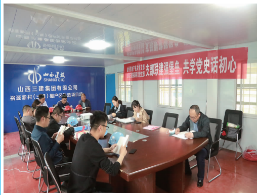
近日,房地产公司创新“党建联建”模式,与山西三建裕源三期项目部开展“支部联建强堡垒、共学党史话初心”联建活动,搭建互相学习、沟通、交流的平台,推进党史学习教育。(顾卫远)