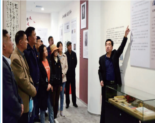
5月14日,徐圩投资公司离退休管理中心党总支开展“红色基因永相传”主题党日活动,30余名内退和退休老党员听红色故事、重温入党誓词、赠送党史书籍,牢记离岗不离党,推动党史学习教育走“新”走“心”。(刘文兵 赵连成)